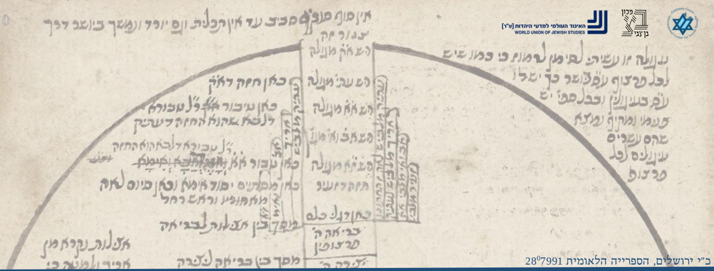
ב"י ירושלים, הספרייה הלאומית 287991